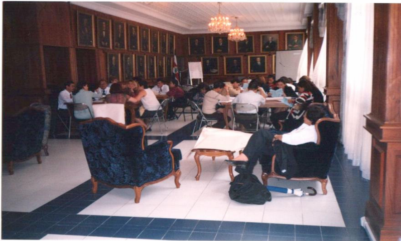
Talleres de Validación de la Política de Género

La Propuesta de la Política de Equidad de Género fue aprobada por Corte Plena en sesión N° 34-05 del siete de noviembre del dos mil cinco, artículo XIV.