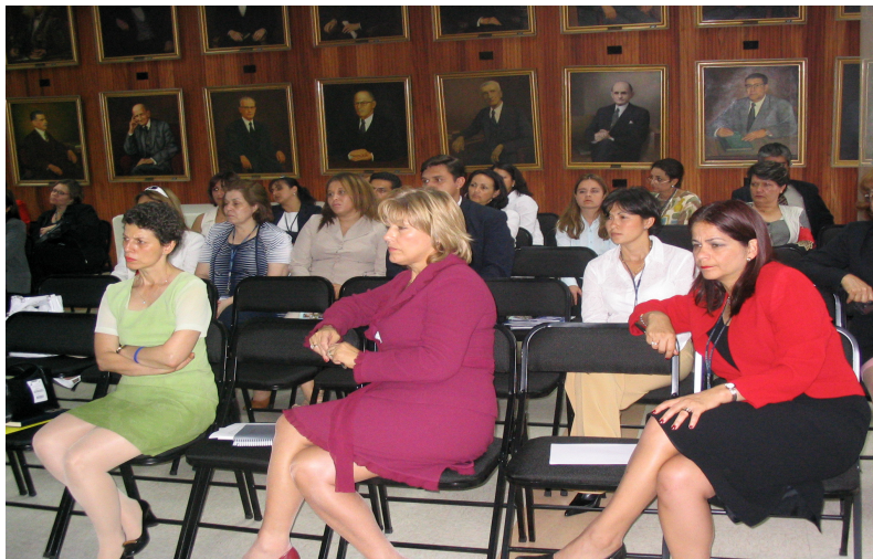
Presentación del libro “Propuesta de Monitoreo de la Ley contra la Violencia Doméstica, Costa Rica” en el Salón de Expresidentes