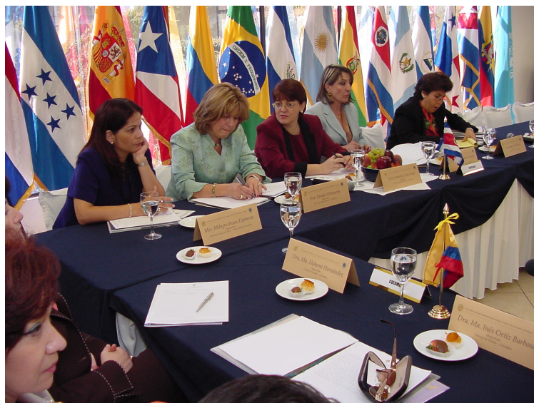
V Encuentro de Magistradas de Latinoamérica por una Justicia de Género