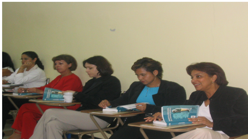
Talleres de Sensibilización en Masculinidad

2. Sensibilización en Masculinidad: Se impartieron veintiuno talleres de Sensibilización en Masculinidad, uno en los Circuitos Judiciales de Alajuela, Cartago, Heredia, Complejo de Ciencias Forenses, Limón, Pococí, Pérez Zeledón, Golfito, Santa Cruz, Liberia, San Carlos, San Ramón, Puntarenas y ocho en San José. Se sensibilizó a quinientas treinta y una personas, de ese total un porcentaje ligeramente mayor fue de hombres, a pesar de los cual la participación por género se mantuvo bastante equilibrada, aspecto que debe resaltarse, en virtud de la tradicional resistencia de los hombres para involucrarse en este tipo de actividades. Dado el interés de los/as funcionarias/os judiciales por este tema se esta diseñando una segunda etapa.